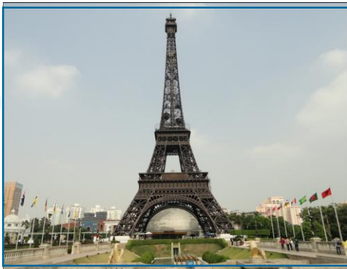
Paris/the Eiffel Tower