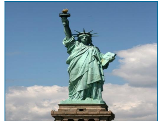
New York/the Statue of Liberty