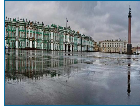
Saint Petersburg/the Hermitage